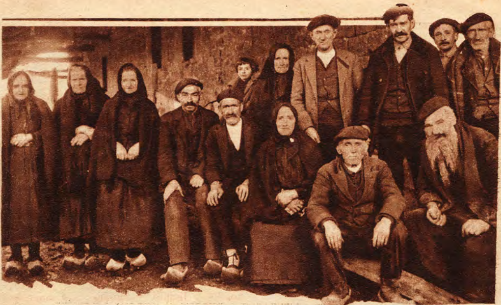
HOMBRES Y MUJERES QUE NUNCA SALIERON DEL TERRUÑO NATAL Y QUE NO TIENEN MÁS AMBICIÓN QUE SEGUIR VIVIENDO LEJOS DEL MUNDANAL RUIDO EN SUS ALDEAS SENCILLAS Y TRISTES, DONDE TODA LA VIDA CREYERON QUE LES ESPERABA LA MUERTE CUANDO FUERAN MUY VIEJOS

de una suave loma, que se salvarán de la inundación de la aldea. Después continúa el llano salpicado de tejados rojos, y otra vez el río se encrespa y embarulla al tomar la senda que tuerce hacia Montés Claros, donde unos frailes, vestidos de blanco, con la Virgen María, son los únicos habitantes del vergel. Por allí se cierra la depresión natural de la tierra, que continúa hundida hasta un pueblo de la provincia de Burgos que le llaman Arijia, y que parece, desde la carretera, una bandada de aviones descansando en el páramo de la Virga, siempre con niebla, siempre con frío, siempre húmedo hasta el confín. Y todo el paisaje de campo y de montañas, de casas aldeanas y de iglesucas, con nidos de cigüeñas, de la noche a la mañana se habrá transformado en un inmenso mar de veinte kilómetros de largo.