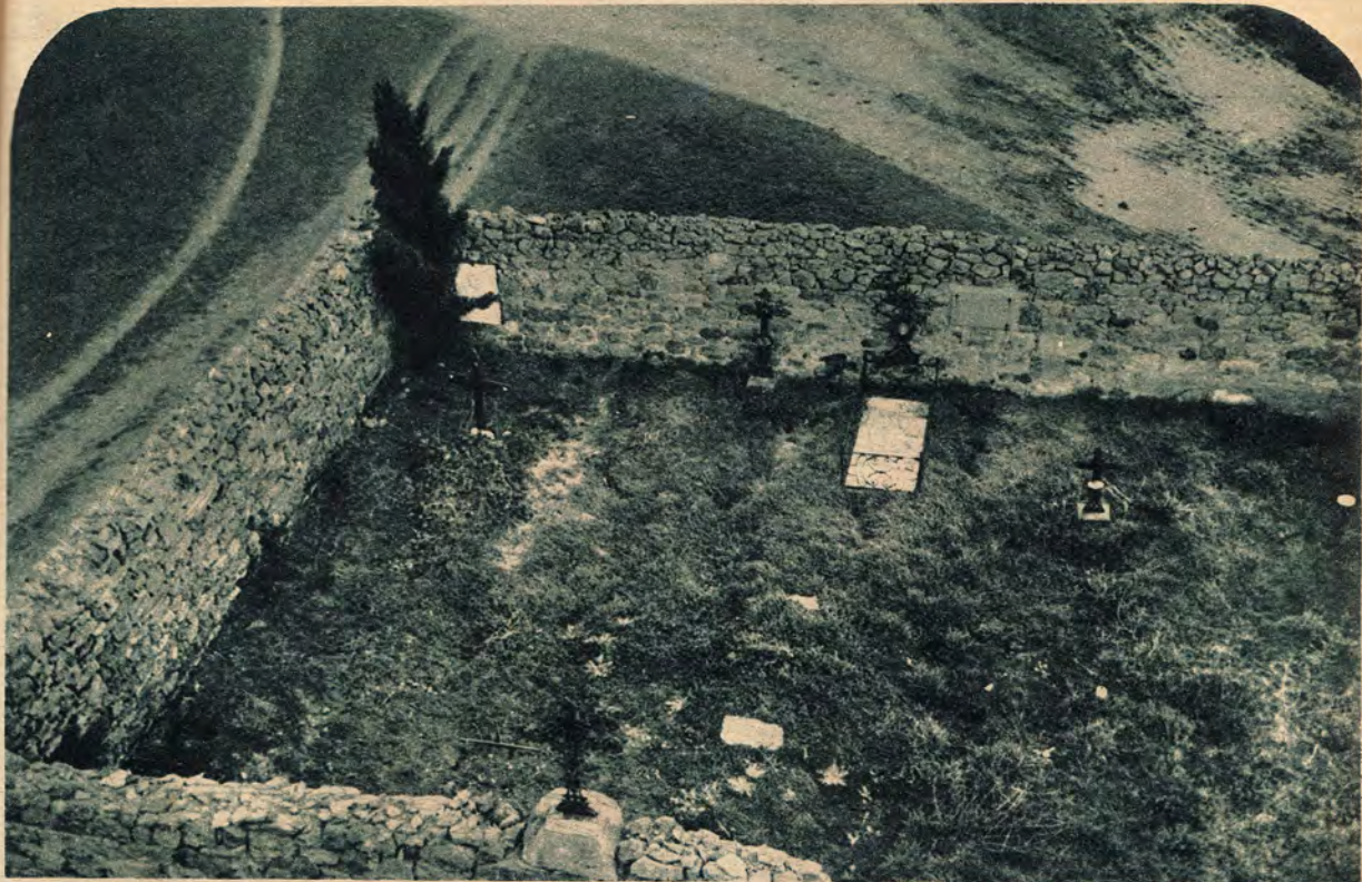
ESTE CEMENTERIO ALDEANO, QUE NO TIENE PANTEONES NI TUMBAS LUJOSAS, ESTÁ LLAMADO A HUNDIRSE BAJO EL NUEVO MAR QUE INVADIRÁ A CAMPÓO. CON ÉL DESAPARECERÁN TODOS LOS RECUERDOS QUE UNE A LOS HOMBRES A LA TIERRA

carro de atascarse en tales condiciones, que todavía no ha habido modo de sacarle del mal paso.