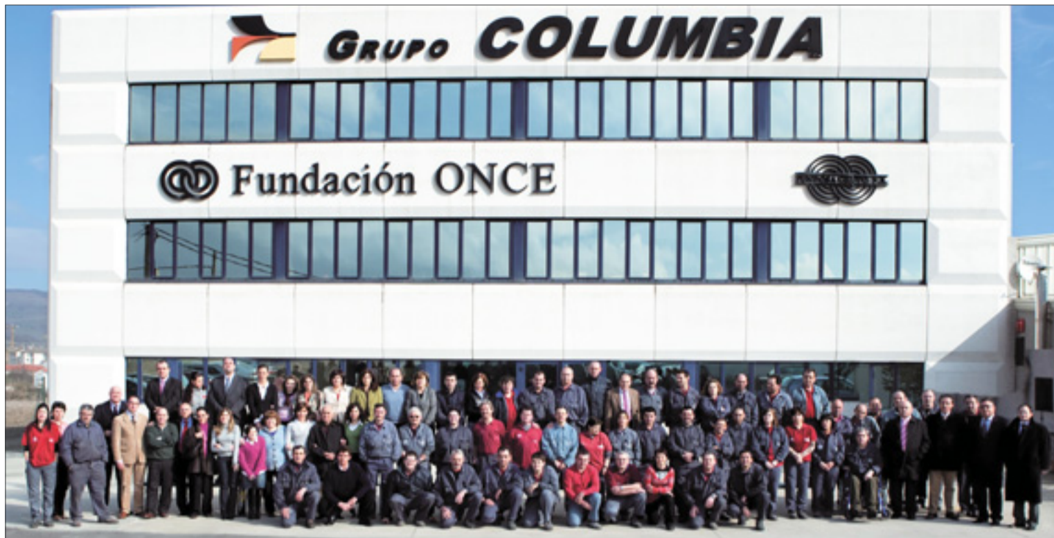
Empleados y directivos de la empresa ante sus instalaciones del polígono de La Vega.