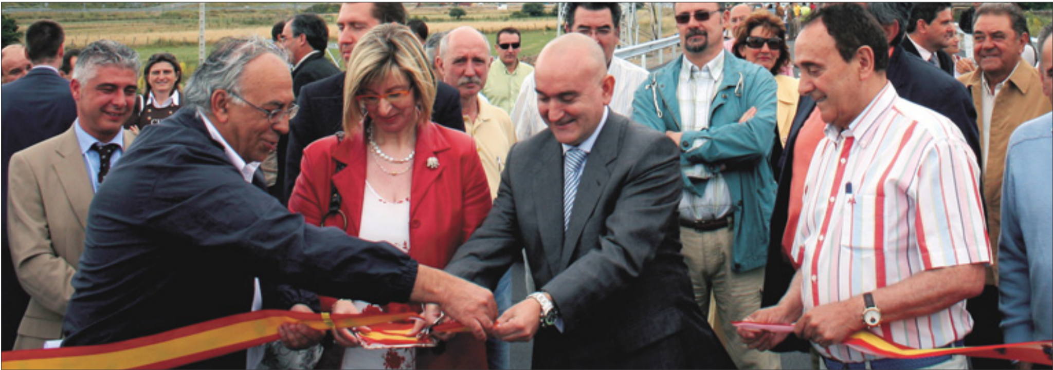
Un momento del corte de la cinta inaugural del nuevo vial de acceso a la Autovía de la Meseta.