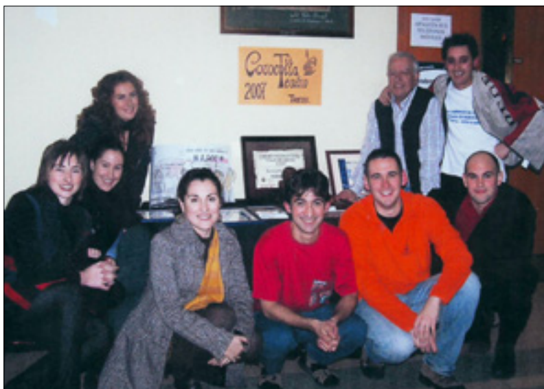
Miembros de la compañía de teatro reinosana Corocotta.

pendiente dos certámenes nacionales en Villablino (León) y Sama de Langreo (Asturias), los días 25 y 26 de octubre, representando las obras 'Hombres' y 'Ay, Carmela', respectivamente.