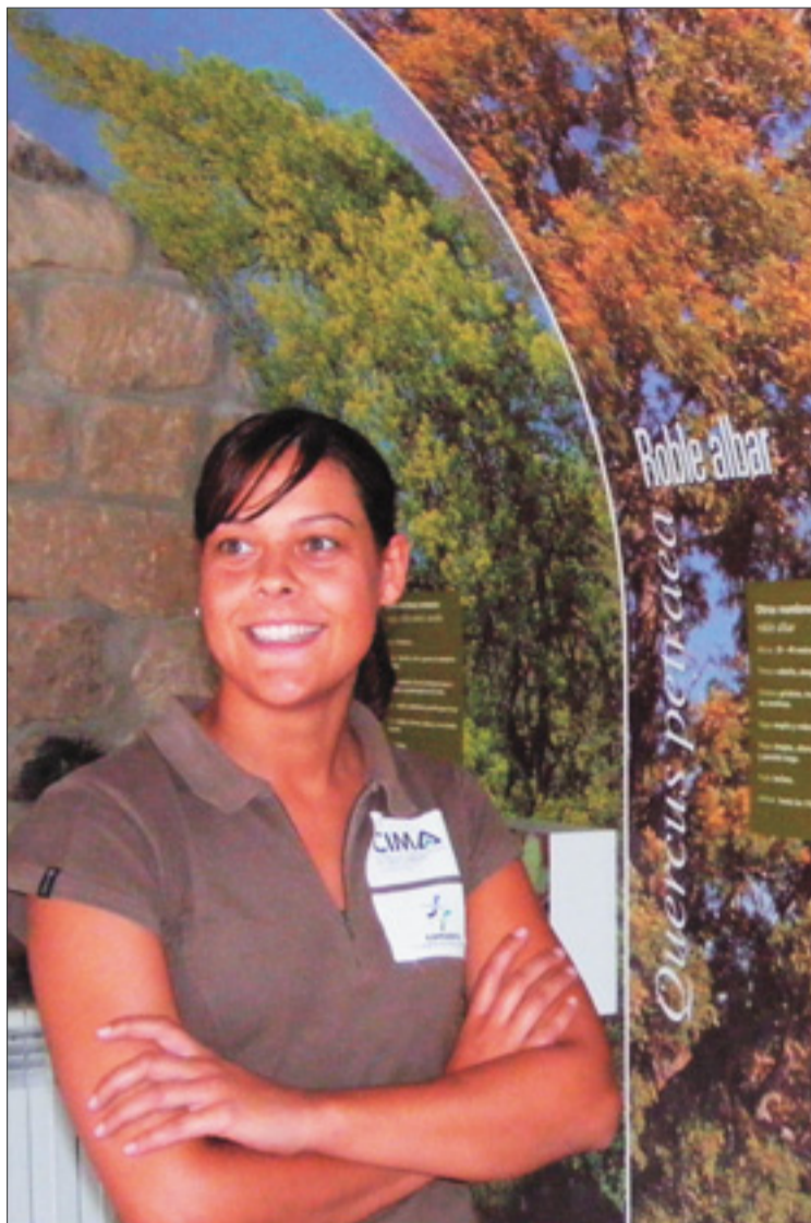
Una de las trabajadoras del Centro ante un panel.

PLANTA BAJA DEL CENTRO. En la planta baja aparecen varios vídeos de aproximadamente diez minutos, presentan información sobre