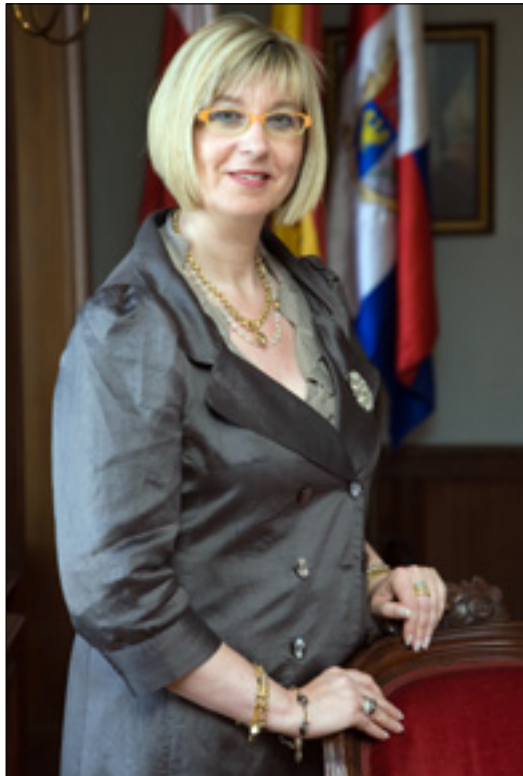
Reyes Mantilla, alcaldesa de Reinosa.

R.- Ciertamente, a los pocos meses de estar gobernando aprobamos el presupuesto que permitió normalizar la situación económica del Ayuntamiento y hace unos meses aprobamos nuestro segundo presupuesto, sin embargo, conseguirlo ha requerido esfuerzo y mucho, mucho diálogo. Por supuesto que no resulta fácil gozar del apoyo de todos los grupos políticos que conforman la Corporación y nunca olvidamos que estamos en minoría, por ende, el equipo de gobierno hizo su trabajo, llegó al consenso y logró su objetivo. Si bien, no es fácil gobernar en minoría, es posible, aunque exige una estrategia distinta. Pero no es éste nuestro único logro. Hemos hecho muchas cosas en estos