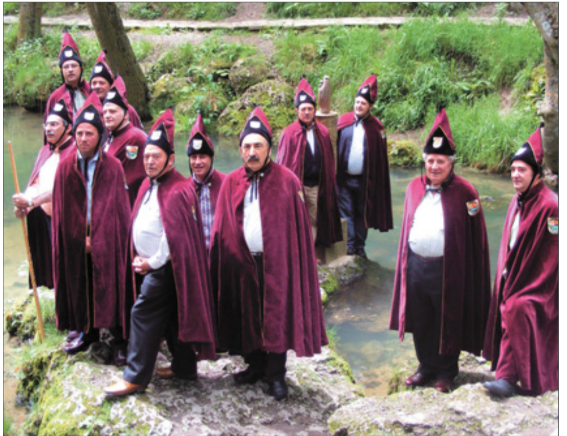
Miembros de la Cofradía Gastronómica Nacimiento del Ebro. / QUEIMADELOS

publicaciones de las Federaciones Españolas, que anuncia las novedades a todos sus asociados y los Capítulos Anuales de todo el país, de forma que las cofradías asocia-