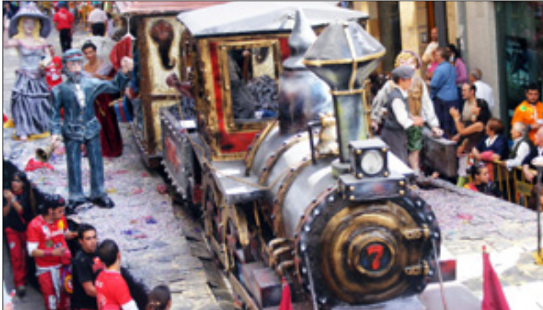
Una de las citas lúdicas de la pasada edición. / QUEIMADELOS

VIERNES, DÍA 26. Tiradas clasificatorias del comarcal de bolos en la bolera de Las Fuentes, desde las 17 horas, organizado por la Peña Bolística Ebro. II Maratón de Fútbol en el Bar de las Piscinas Climatizadas, organizado por Recreativos y Expendedoras Díaz, a las 18