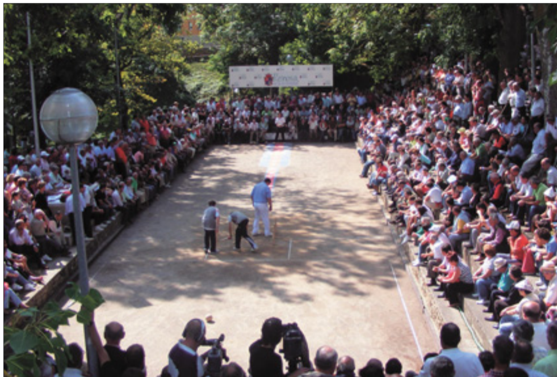
La bolera de Las Fuentes durante el torneo del pasado año.

Desde hoy sábado 20 y hasta el domingo Día de Campoo se inaugura el I Open de Tenis, y se celebran las tiradas de rana cuya final es mañana día 21, desde las 11 de la mañana y hoy también a las 4 de la tarde, en la Plaza de España. El Tiro al Plato tiene su cita en el campo de tiro de Requejo, desde las 15.30 horas. El Naval y el Torina se enfrentan hoy a las 18 horas, en par-