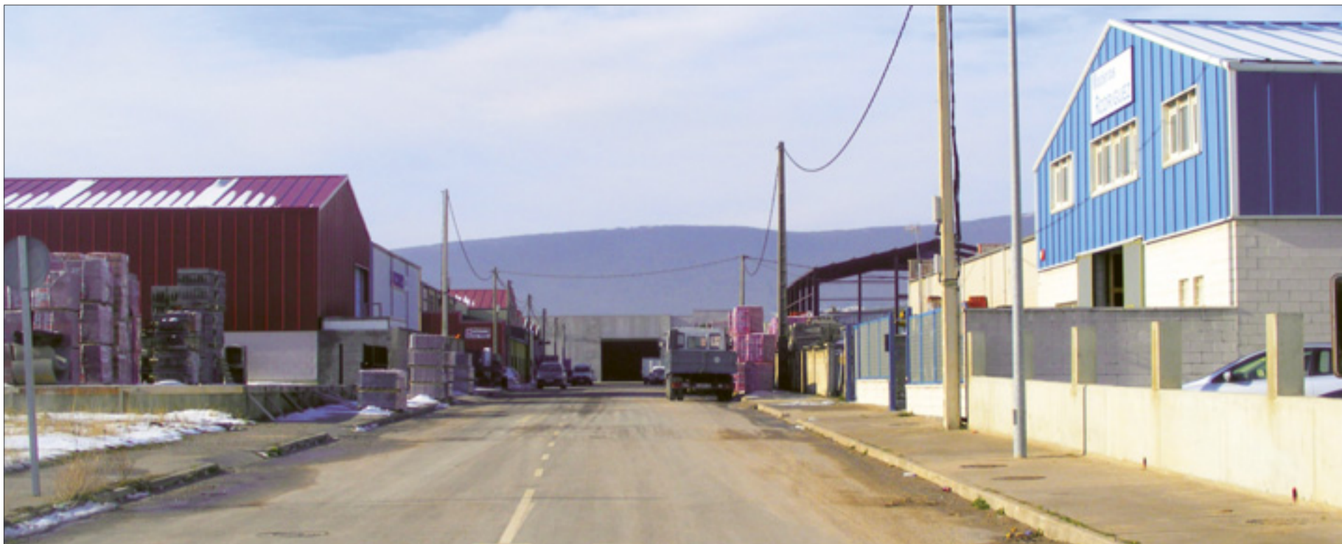
Uno de los viales del polígono de La Vega.