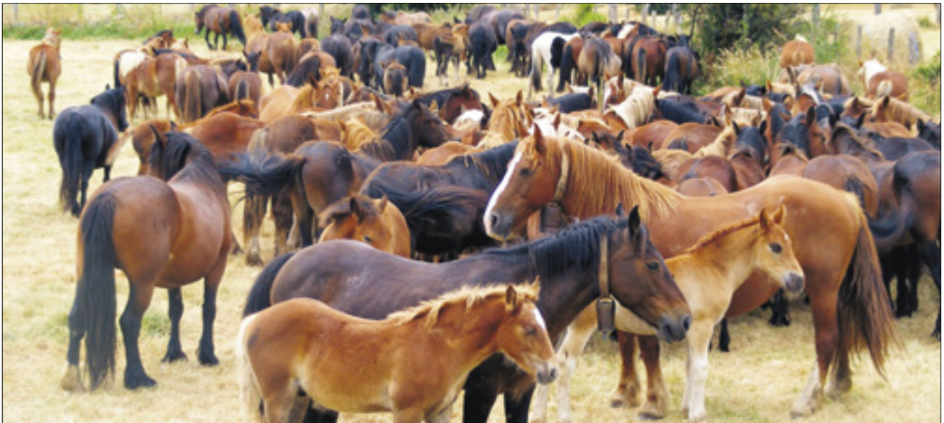
Una manada de caballos en la comarca de Campoo.