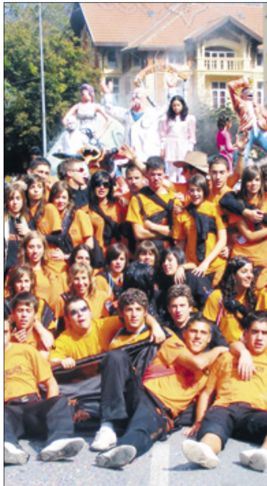
Varios jóvenes en las fiestas del pasado año.

los Obeso, trasladándose al Pabellón Municipal en caso de lluvia.