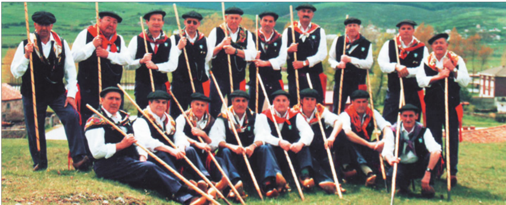
La Ronda La Esperanza de Requejo participa en las fiestas.