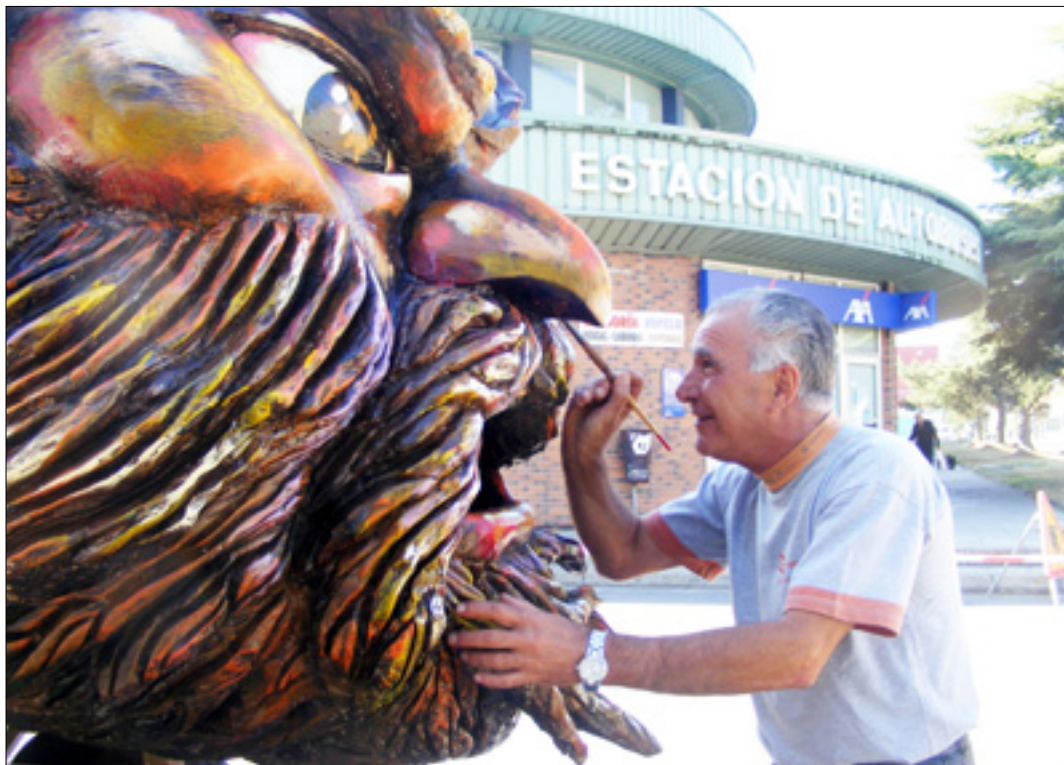
Un carrozista pinta una de las figuras de la carroza de la Reina y Damas de Honor de San Mateo.

La Peña Sierpes formada por ochenta chavales que se presentan por segundo año, presenta la carroza 'Leyendas del Rock' basada a través de la caricatura en músicos internacionalmente conocidos. Los Wüapelo por primero año presen-