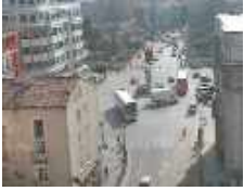
La plaza de Mío Cid en Directo

No se permiten comentarios Anónimos, Regístrate por favor