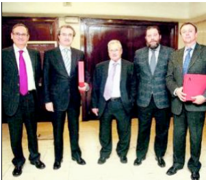
Miembros de la Federación de Municipios con Embalses, tras la reunión celebrada en Montoro.

comentarios enviar imprimir valorar añade a tu blog