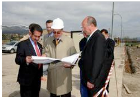
Revilla visitó el polígono industrial de Reinosa.

De las obras previstas por el Estado, además de destacar la importancia que para Campoo tiene la finalización "en un año" de la Autovía de la Meseta , Revilla apuntó a la importancia que para la comarca tienen las obras que se incluirán en el Plan Estratégico de Infraestructuras del Transporte (PEIT) del Ministerio de Fomento como el tren de Alta Velocidad, la autovía Aguilar de Campoo-Burgos y la