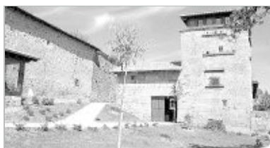
CAMPOO DE SUSO. El Centro de Interpretación del río Ebro está en Fontibre.

Esta actuación se incluyó dentro del programa de Restitución Territorial, que se llevaba a cabo en el entorno del Embalse del Ebro. Esta actuación se incluyó dentro del programa de Restitución Territorial en el entorno del Embalse del Ebro. El centro del Embalse del Ebro de Corconte se abrió en verano del 2001 en las antiguas escuelas de la localidad de Campoo de Yuso. Las obras de construcción de esta instalación fueron adjudicadas a la empresa SIEC, con un presupuesto de 162.273 euros.