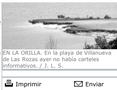
EN LA ORILLA. En la playa de Villanueva de Las Rozas ayer no había carteles informativos.

La Confederación Hidrográfica asegura que los carteles que ha empezado a colocar en el perímetro del Embalse del Ebro informan sobre los riesgos del baño y la navegación en algunas zonas por la alta cota alcanzada este año, pero no implican prohibiciones, sino algunas restricciones. De momento sólo se han colocado paneles en la zona de Orzales y Corconte.