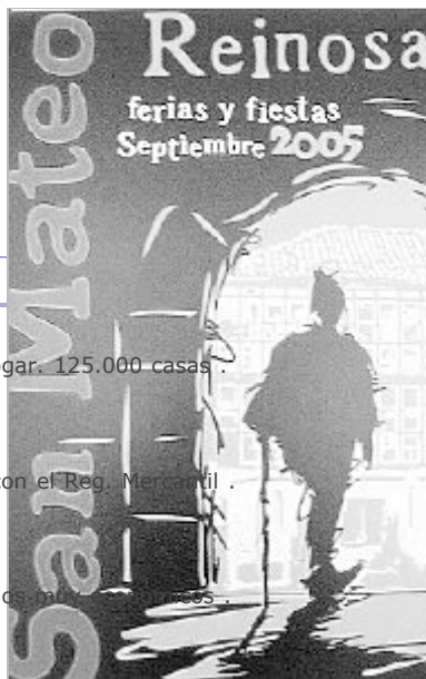
Cartel ganador. / DM poetas noveles e inéditos .

Premio de 150 Euros.Editamos poemas Buscamos poetas noveles e inéditos. www.centropoetico.com