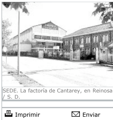
SEDE. La factoría de Cantarey, en Reinosa.

En 2003 la multinacional Gamesa adquirió el 100 por ciento de la empresa, actuación esta que permitió la continuación de la actividad. Con la entrada de Gamesa, el mercado eólico sigue siendo la principal meta de la compañía, si bien es interés de la matriz reducir el peso específico de éste sobre el total volumen.