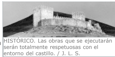
HISTÓRICO. Las obras que se ejecutarán serán totalmente respetuosas con el entorno del castillo.