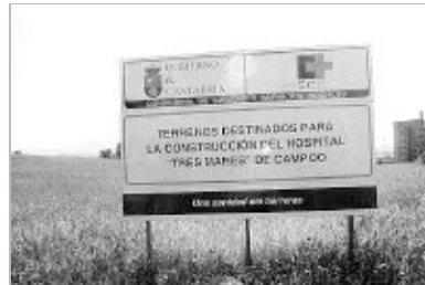
CESIÓN. Terreno en el que se construirá el Hospital.

Según el Servicio Cántabro de Salud, el Hospital Tres Mares se encuentra actualmente en fase de redacción del proyecto de ejecución, así como del estudio de seguridad y dirección facultativa de las obras de construcción, adjudicado a la empresa Lahoz-López Arquitectos S L Para la construcción de este centro sanitario está previsto un presupuesto de 18 millones de euros. Según Sanidad, el centro está diseñado pensando en las necesidades del pacientes y sus familiares: accesibilidad, confort, respeto de la privacidad y derecho a estar acompañado en todo momento.