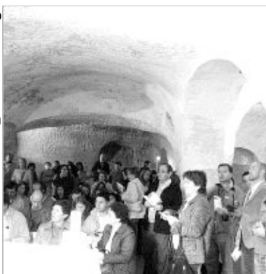
Asistentes a una actividad en Valderredible.

En el curso académico 2005-2006 la colaboración de las mismas entidades ha hecho posible la segunda fase de esta actividad, que durante este año se centrará en la comarca de Campoo y en el Valle del Besaya. Consta de cuatro itinerarios que se iniciaron el 8 de octubre y que tendrán continuidad el 12 de noviembre, 17 de diciembre y 14 de enero de 2006, en el curso de las cuales se visitarán los templos más relevantes de los municipios de Valderredible, Valdeolea, Enmeda, Reinosa, Pesquera, Bárcena de Pie de Concha, Molledo y Arenas de Iguña.