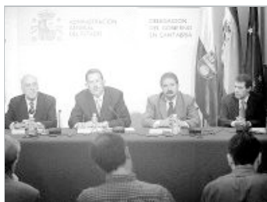
FALLO. Organizadores y patrocinadores, ayer.