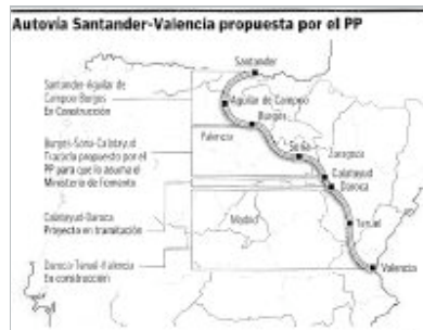
BORRADOR. Muestra del trazado en base a la idea del PP. / DM

En Puertochico, la apuesta por esa futura 'Dos Mares' es bien distinta. De hecho, Revilla ha conseguido que el Gobierno central destine en el próximo Presupuesto un millón de euros para el proyecto informativo de dicha autovía. La pretensión es que entronque con la Autovía de la Meseta a la altura de Pesquera y que, desde allí, el trazado llegue hasta las inmediaciones de Miranda de Ebro tras unos 100 kilómetros de recorrido.