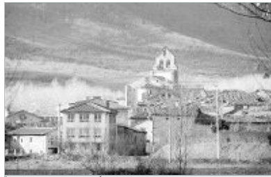
REHABILITACIÓN. El mal estado de la estructura obligó a la reforma del templo.