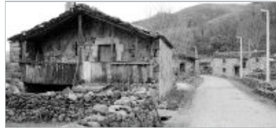
MALA CARRETERA. Cabañas vividoras de Pandillo, uno de los barrios más típicos del municipio de Vega de Pas.

Con la futura actuación en el puerto de Estacas de Trueba y el acceso a Pandillo, el municipio pasiego dispondrá de una red de comunicaciones por carretera acorde con el siglo XXI, una de las demandas más persistentes de su regidor municipal.