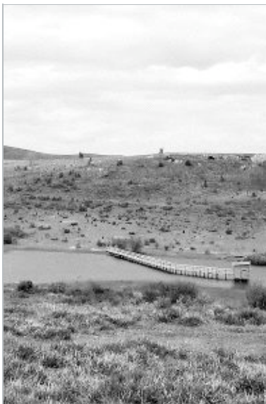
Observatorio de aves del centro medioambiental.

El proyecto medio ambiental que se planificó en Campoo hace más de seis años, a través de