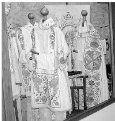
En la vitrina-museo hay varias casullas antiguas.

Deseos cumplidos. Los padres del Santuario de Montesclaros, ubicado en el municipio campurriano de Valdeprado del Río, llevan desde 1686 trabajando en la conservación de este conjunto arquitectónico que ha pasado por épocas de esplendor y por otras menos brillantes. Restaurar lo desgastado y poner en valor todo aquello que se encuentra guardado es el objetivo de los actuales frailes. En esta ocasión han contado con la financiación de cuatro consejerías del Gobierno regional y con el trabajo de los operarios de la Escuela Taller de Reinosa. Así, se ha construido en el convento una vitrina-museo donde se guarda la Virgen de Montesclaros, varias casullas, fotografías y objetos religiosos.