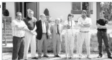
Las autoridades presentes en el acto de inauguración celebrado ayer en Polientes.

Medio Ambiente mejorará también la red de aguas del municipio.