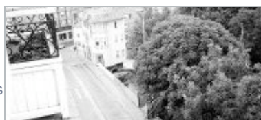
Los trabajos han sido suspendidos hasta nuevo aviso. / S. D.

El alcalde de Reinosa, José Miguel Barrio, ha ordenado la paralización de las obras de ampliación y modificación del puente del Ebro de la Avenida Carlos III. Esta decisión ha sido adoptada por el regidor atendiendo las demandas que, en este mismo sentido, le han presentado los partidos de la oposición municipal, especialmente el PP, PSOE y UCn, que se felicitan por la orden dada por el alcalde, así como por numerosos vecinos que se han venido manifestando a favor de que se respeten las piedras del petril del puente.