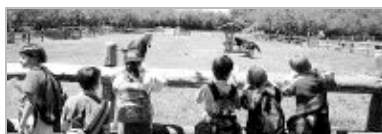
El centro iba a ser abierto el 5 de junio con motivo del Día Mundial del Medio Ambiente, pero esa apertura no llegó a celebrarse. / J. L. S.