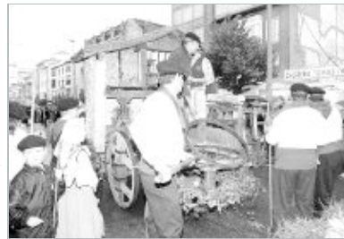
La carreta titulada 'Herrando ruedas' de Orzales, fue la ganadora del concurso de carretas.