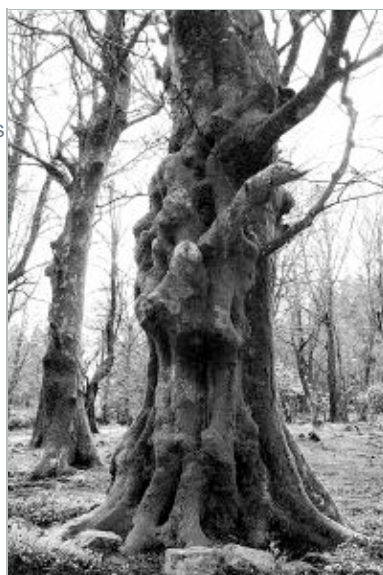
La magia de una masa arbórea desnuda de hojas

En esta línea de actuación se enmarca un programa de prevención de incendios. Orientado a mostrar a los alumnos de los centros de Secundaria la rica biodiversidad