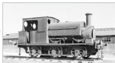
Estado de la locomotora, en su actual ubicación en Francia.

Posteriormente, y una vez terminada su labor en dicha línea, la locomotora fue vendida, pasando a prestar sus servicios en la Azucarera de Castilla. Allí fue numerada como «Azucarera de Castilla Nº 1» y formó parte de los trenes que salían de aquella