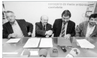
Apretón de manos entre el consejero y el alcalde de Valderredible.