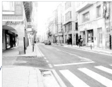
La calle Mayor será peatonalizada desde el Cañón hasta Deltebre / S. D.

Cuando este plan fue elaborado y aprobado, una de las novedades destacadas del proyecto, cuyo objetivo está dirigido a mejorar las condiciones de estacionamiento, tráfico, y circulación peatonal, es la transformación en peatonal de la calle Mayor, desde la curva del Cañón hasta la entrada a la calle Deltebre. En el proyecto inicial se contemplaba también la «recuperación del adoquinado existente bajo la actual capa de asfalto», adoquinado este que fue totalmente eliminado en las recientes obras de saneamiento que se realizaron en todo el tramo de calle.