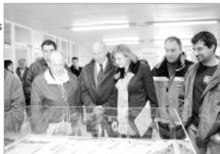
La maqueta del Hospital Tres Mares se encuentra expuesta en la planta baja del Centro de Salud.