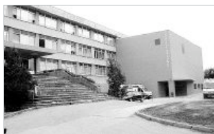
El edificio del Hospital Campoo será demolido.

Las obras del proyecto se distribuyeron en tres fases, finalizando la primera, por importe de 1,2 millones de euros, en 2003, con la puesta en servicio de un nuevo módulo destinado a los actuales servicios de urgencias. Con esta actuación se pretendían resolver las necesidades más urgentes que estaban planteadas en el centro hospitalario, como una nueva instalación de Rayos X, reforma de la zona quirúrgica y de urgencias, así como la creación de nuevos servicios. Cuando en 2003 Quintana accedió a la Consejería, su primera decisión fue anular este proyecto.