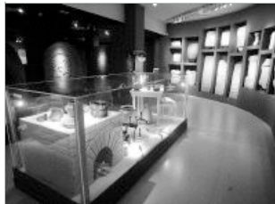
Vista general de una de las salas del Museo de Prehistoria tras la remodelación.

Ya han pasado cinco años desde que el diseño de Mansilla y Tuñón fuera elegido, en diciembre de 2002, como el ganador del concurso convocado por el Gobierno del PP. Lo que sí está es presupuestado: 59 millones de euros, aunque de su sistema de financiación, por ahora, se desconoce casi todo. Se están barajando «varias fórmulas», aseguró López Marcano, que van desde la financiación estructurada hasta la colaboración de diferentes entidades, tanto públicas como privadas, algunas de las cuales ya se «han ofrecido» a participar.