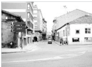
Las obras de peatonalización de la calle Mayor obligan a su cierre.

Según la información que facilita el Ayuntamiento, mañana, lunes, darán comienzo los trabajos de peatonalización de la calle Mayor y anexos. Como consecuencia de estas obras y con el fin de facilitar su ejecución y las de pavimentación de la Plaza de España, durante el tiempo que duren las mismas, unos seis meses aproximadamente, la citada calle permanecerá cortada al tráfico de vehículos.