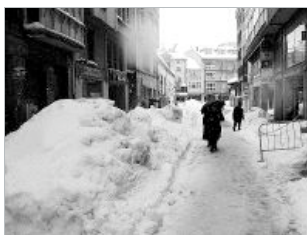
La calle Mayor se encuentra cerrada al tráfico por obras.