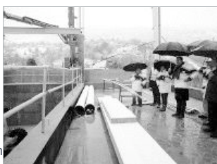
Las obras del bitrasvase estarán terminadas en mayo.

Las obras del bitrasvase Ebro-Pas-Besaya, que ejecuta la Administración Regional en colaboración con el Ministerio de Medio Ambiente, estarán concluidas el próximo mes de mayo y «al día siguiente» se conectará con la llamada Autovía del Agua. Así lo ratificó ayer el director general de Obras Hidráulicas y Ciclo Integral del Agua, Francisco Martín.