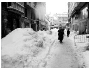
La calle Mayor se encuentra cerrada al tráfico por obras.

Según el alcalde, José Miguel Barrio, «estamos poniendo toda la carne en el asador. Tenemos contratadas 10 máquinas y tres minifresas, pero a pesar de estos trabajos, nos vemos desbordados, pues tenemos que actuar de forma prioritaria en abrir los accesos a las Residencias de Ancianos, al Hospital, Centro de Salud, colegios, al polígono de La Vega, etc»..