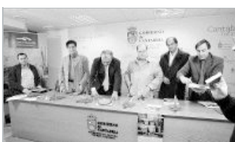
El consejero de Cultura corta, en el centro, una quesada en presencia de los alcaldes.