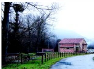
El valle volverá a ser el escenario de una nueva película de Cre-Acción Films.

No hay remedio. Por más que tratemos de ignorarlo, el pasado muchas veces golpea de nuevo, vuelve a llamar a nuestra puerta para saldar viejas deudas. Eso es lo que le ocurre a Julia, una joven de la gran ciudad, que regresa al pueblo de su madre -sin saber bien por qué ni a qué- y descubre un pasado revelador que empezará a dar sentido a su vida. De pronto, sus esquemas de chica cosmopolita se le rompen y descubre unos nuevos valores que darán un rumbo a su existencia, dotándola de una alegría hasta ahora desconocida.