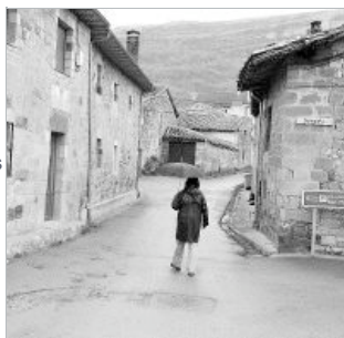
Vistas de los enclaves rurales de San Martín de Elines (Valderredible), izquierda, y Aldea de Ebro (Valdeprado del Río).