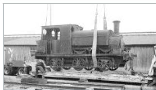
Labores de descarga de la locomotora para transportarla hasta los talleres de Lérida.