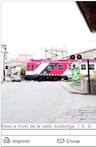
Paso a nivel de la calle Julióbriga. / S. D.

Los proyectos planteaban la anulación total de los pasos a nivel para para el tráfico de vehículos, y en el caso del paso de la Avenida Castilla, la construcción de un paso subterráneo peatonal, mientras que la circulación se canalizaría por el nuevo puente.