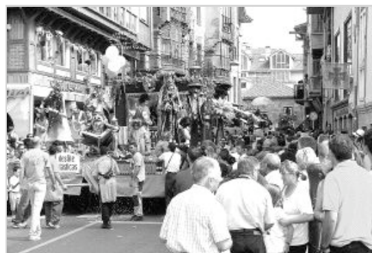
El espectáculo de carrozas, que en la noche de ayer hizo el primer recorrido, es uno de los actos que mayor número de personas concentra en la ciudad. /S.D.

Para el sábado, día 22, se encuentran programados varios actos con torneo de golf, campeonato de relevos de natación, bike-trial, tiro al plato, carrera de tiro de perros, bolos, baloncesto, fútbol veteranos, actuación de Mariachis, fuegos artificiales, a las 23,30, en la Plaza de España, concierto de Los Pecos, y a continuación, en la Plaza Juan XXIII, verbena. El domingo, día 23, se realizará el Rallie fotográfico y a partir de las 9 horas, en el Teatro Principal, se celebrará la fase de selección de todas las categorías, excepto rondas, del certamen folclórico del Día de Campoo. Además de un concierto de la Banda Juvenil Mixta en la Plaza de España, por la tarde, entre las 17 y las 20 horas, en la Plaza de España, espectáculo de Los Lunnis. En los días sucesivos, hasta el día 30, se celebrarán numerosos actos y exhibición de baile en el Hotel Vejo, una serie de conciertos en el polideportivo viejo organizados por la Asociación de Hostelería de Reinosa, teatro, pruebas deportivas, Día de las Peñas, festival de coctelería, así como otra serie de actos que finalizan con el Día de Campoo.