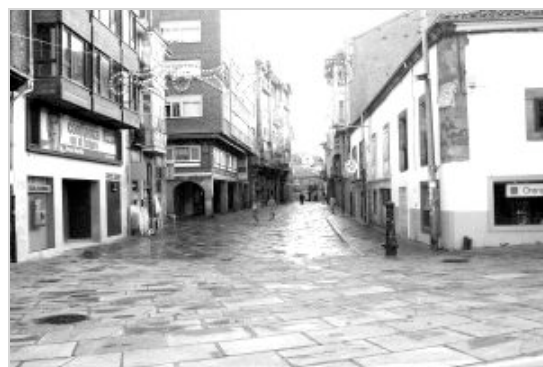
Esta es la nueva imagen que actualmente ofrece la Calle Mayor.

A medida de que el trazado y nuevo diseño de la zona peatonal se ha puesto en uso, han ido prácticamente desapareciendo las voces discrepantes que mantenían dudas sobre los pros y contras que supondría la eliminación del tráfico rodado a través de la Calle Mayor. Además de la opinión favorable que manifiestan la mayoría de los responsables de los negocios e instalaciones afectadas por la nueva situación del vial urbano, lo hacen de igual manera los vecinos del entorno y personas que habitualmente frecuentan la zona centro de las ciudad.