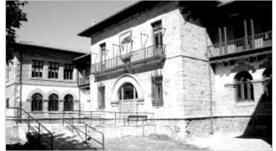
El colegio Concha Espina es un edificio idóneo para acoger el Museo Etnográfico . / S.D.

El volumen actual del fondo artístico municipal está formado por un elevado número de obras de arte, pintura, escultura, cerámica y otros elementos, que precisan de un estudio minucioso para su reagrupamiento, catalogación, y exhibición permanente para que se pueda conocer. Personas y sectores relacionadas con el arte y la pintura vienen desde hace años reclamando la creación en la ciudad de un Museo Etnográfico y de Arte destinado a acoger esta parte del patrimonio municipal.