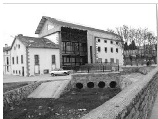
El molino Los Obeso, afectado por un incendio, fue adquirido por el Ayuntamiento.

Los molinos y los trabajos de molienda que en ellos se hacían, fueron los principales impulsores de la economía de Reinosa en el siglo XVIII y posteriores. En los últimos años, y de forma escalonada, han ido desapareciendo los molinos, así como las presas y represas que se localizaban a lo largo del cauce del Ebro, desde su nacimiento, en Fontibre, hasta el embalse. De forma paralela a la eliminación de esas instalaciones de molienda, han desaparecido igualmente sus canales de alimentación. En los cinco kilómetros de recorrido que tiene el Ebro desde su nacimiento, en Fontibre, hasta Reinosa, existían unas nueve presas que daban servicio a otros tantos molinos.