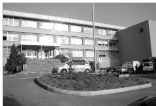
La antigua Clínica, tras cesar como hospital, pudiera albergar un centro geriátrico.

El pasado año entró en funcionamiento la nueva instalación, Residencia II, con la creación de 68 nuevas plazas. En la actualidad, todas estas plazas se encuentran cubiertas, existiendo una larga lista de espera de personas que tienen solicitado su ingreso. Los responsables del centro proyectan habilitar una tercera planta que proporcionaría 28 nuevas plazas.