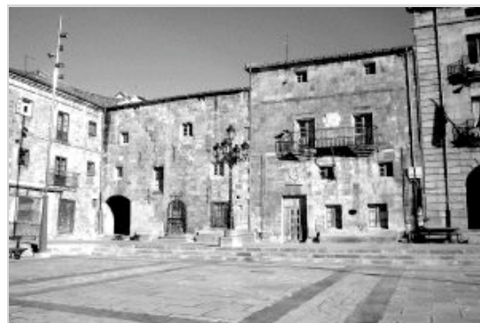
Los Torreones, anexos al Ayuntamiento, son los edificios monumentales más antiguos.