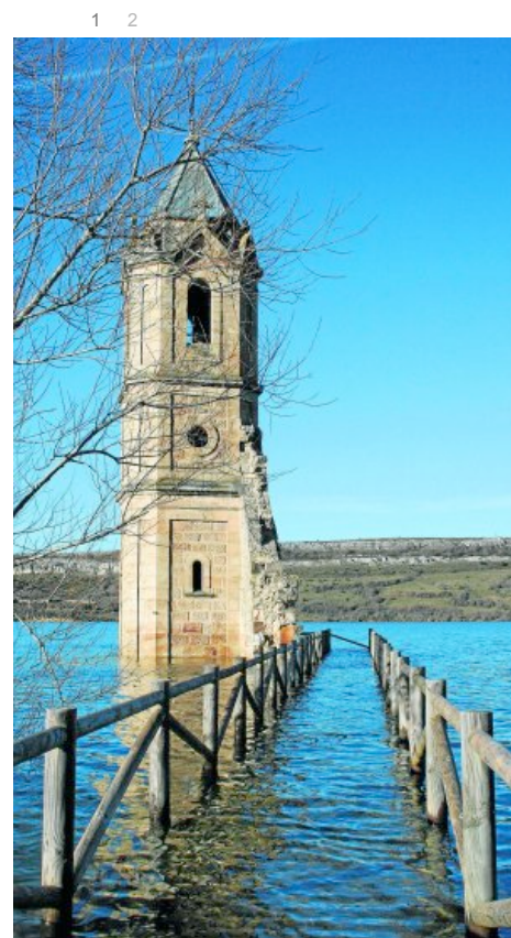
La torre de la antigua iglesia de Renedo, anegada por las aguas del Pantano.