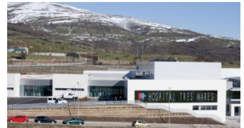
El nuevo hospital Tres Mares atenderá a 21.000 vecinos de las zonas de Campoo y Los Valles.