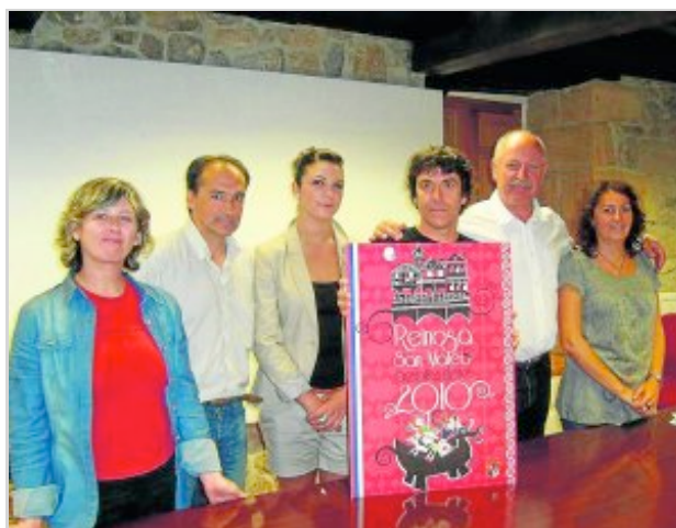
Cartel ganador de las fiestas de San Mateo 2010 que se celebran en la capital campurriana.

A la pasada edición del certamen se presentaron trece establecimientos (este año, serán 19) y el jurado valoró especialmente tanto el aspecto de los pinchos como su textura, sabor y originalidad.