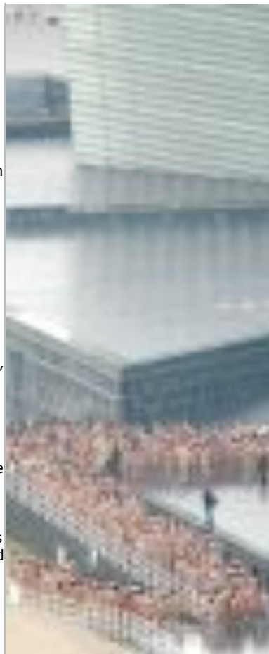
Los surferos no quisieron perderse el espectáculo. [USOZ]

«El madrugón ha valido la pena», aseguraba