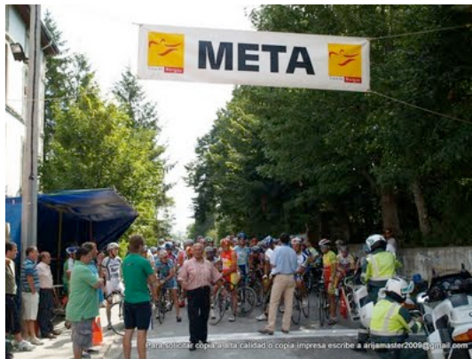
Que apañado el Coke con la sartén jejej