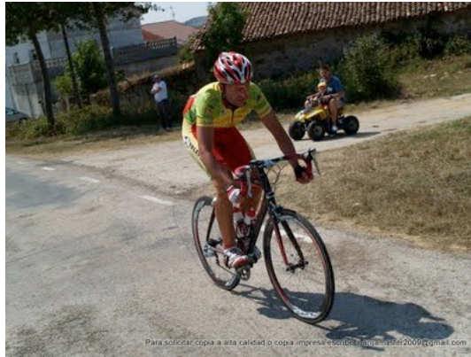
Nuestro Pablo que realizo una buena carrera