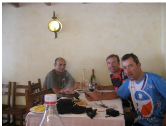
uffffffff, aqui no se queda de rueda nadie jajajajajaja.....