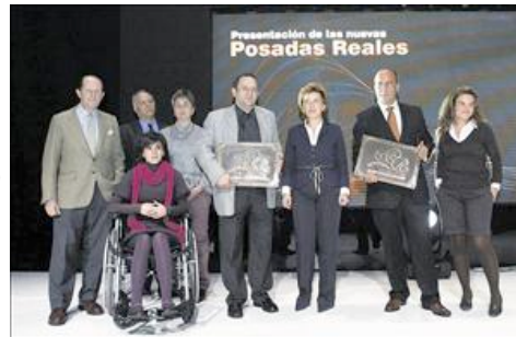
La consejera de Cultura y Turismo junto a los representantes de las nuevas posadas reales.

Cinco nuevos establecimientos rurales se incorporaron a la red de posadas reales de Castilla y León, que ya suman 55 repartidas por toda la Comunidad Autónoma. En concreto, se unen a esta denominación los centros de turismo rural 'Hostería Camino' de Luyego de Somoza en León; 'Faenas Camperas' de Cabeza de Diego Gómez en Salamanca; 'Casa Tepa' en Astorga (León); 'Los Condestables' en Villalpando (Zamora) y 'Las Pascasia' en Puebla de Sanabria (Zamora). A las cinco la consejera de Cultura y Turismo les agradeció su apuesta por la calidad, así como a las que ya tienen la denominación que tienen que continuar con esa apuesta para seguir siendo posada.