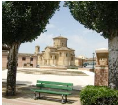
San Martín de Frómista. / ARGÍ

Este domingo toman el relevo la quesería burgalesa La Casona de los Pisones, los quesos Lagunilla y La Olmeda, de la localidad palentina de Lagunilla de la Vega, y el queso leonés Artesano de Cabra de la localidad de Viñayo, entre otras pequeñas industrias familiares de conservas, orujos, cecinas, miel y repostería artesanal, con la participación de artesanos de La Rioja y Cantabria. En torno a cinco mil personas se darán cita en los alrededores de la joya del románico, que disfrutarán, al mismo tiempo, de la concentración ecuestre que todos los años atrae a numerosos visitantes a la localidad palentina dos días antes de la festividad de Santiago Apóstol.