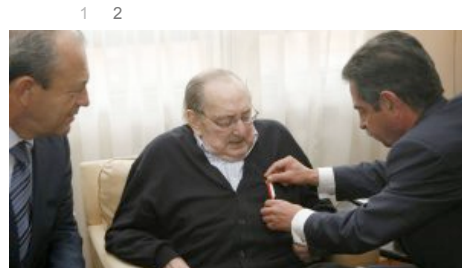
Miguel Delibes recibe la Medalla de Oro al Mérito Turístico de Cantabria que le impone su presidente, Miguel Ángel Revilla, en presencia del consejero de Turismo.

El acto, que había abierto el consejero de Turismo de Cantabria, Francisco Javier López, lo cerró con su peculiar estilo el presidente cántabro, Miguel Ángel Revilla, quien puso la nota de humor al asegurar que el escritor y él habían cantado juntos una coplilla referente a los días de la inauguración del ferrocarril y