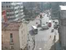
La plaza de Mío Cid en Directo