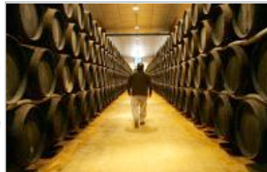
INTERIOR. De las instalaciones bodegueras de La Guita en Sanlúcar.